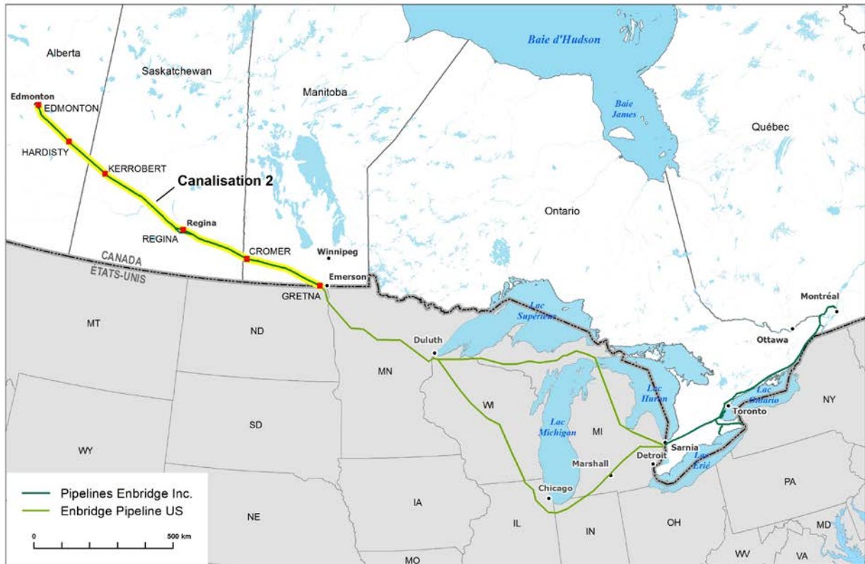
Figure 1 : Canalisation 2 d'Enbridge